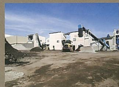
■クラッシャープラント

工事現場から発生するアスファルト塊・コンクリート塊の廃材を粉塵・騒音など公害防止対策完備の工場にて新たに建設資材(再生骨材・路盤材)として、生まれ変わります。